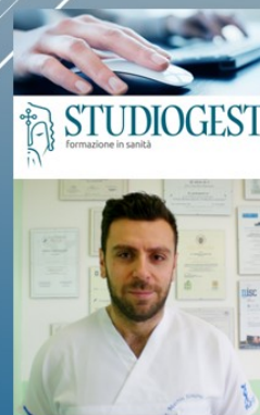
FT DO SIMONE MARTIN